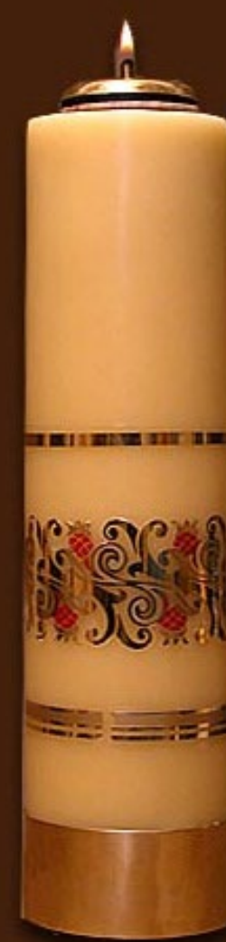
SO 8 DS