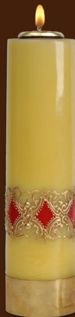
SO 20 DR