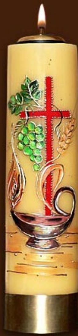
SO 10 DR