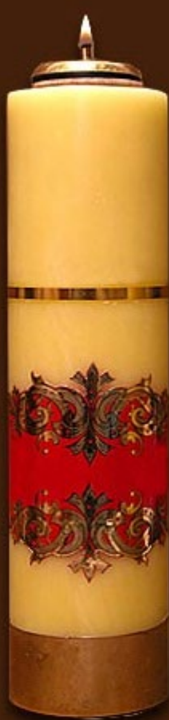
SO 5 DS