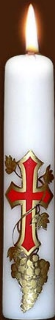
S 1 DS