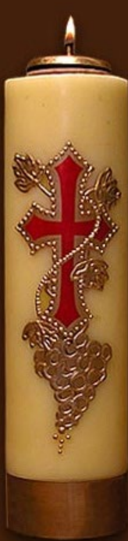
SO 1 DS