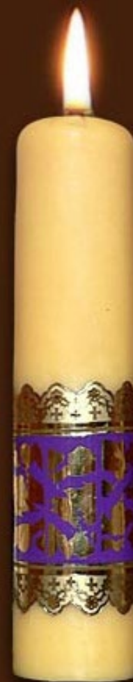
S 8 DS