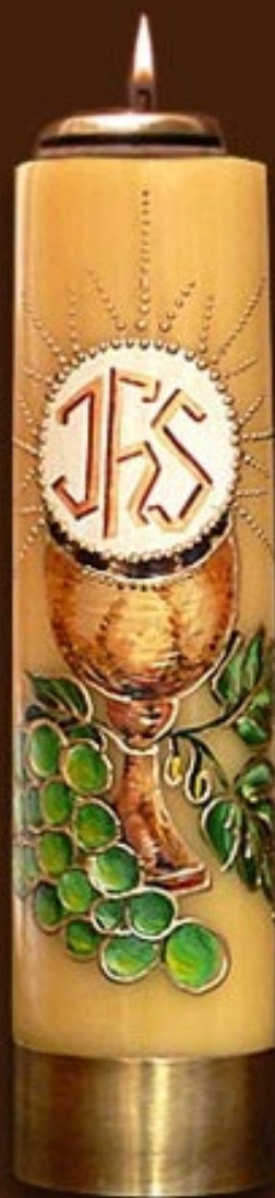
SO 9 DR