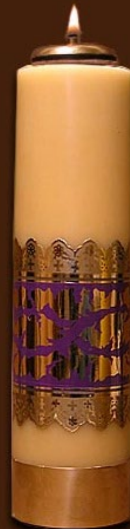
SO 7 DS