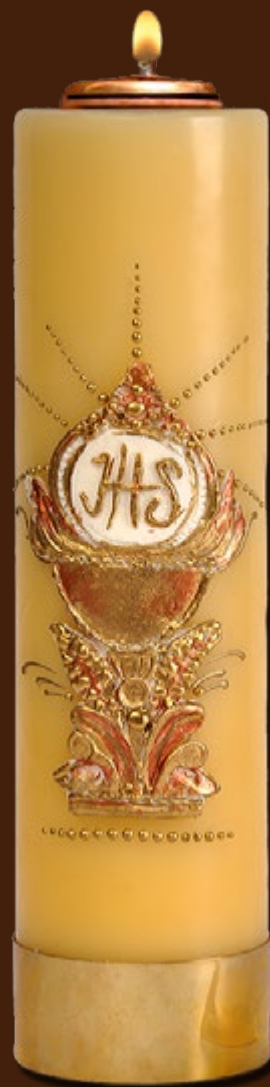
SO 18 DR