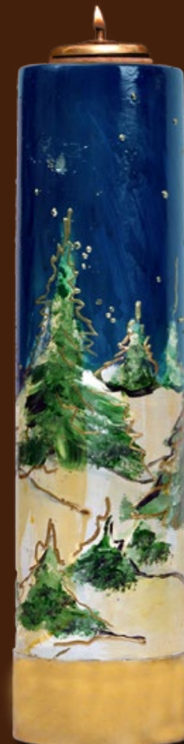
komplet wigilijny SO 14 DR