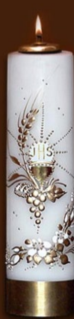
SO 7 DR