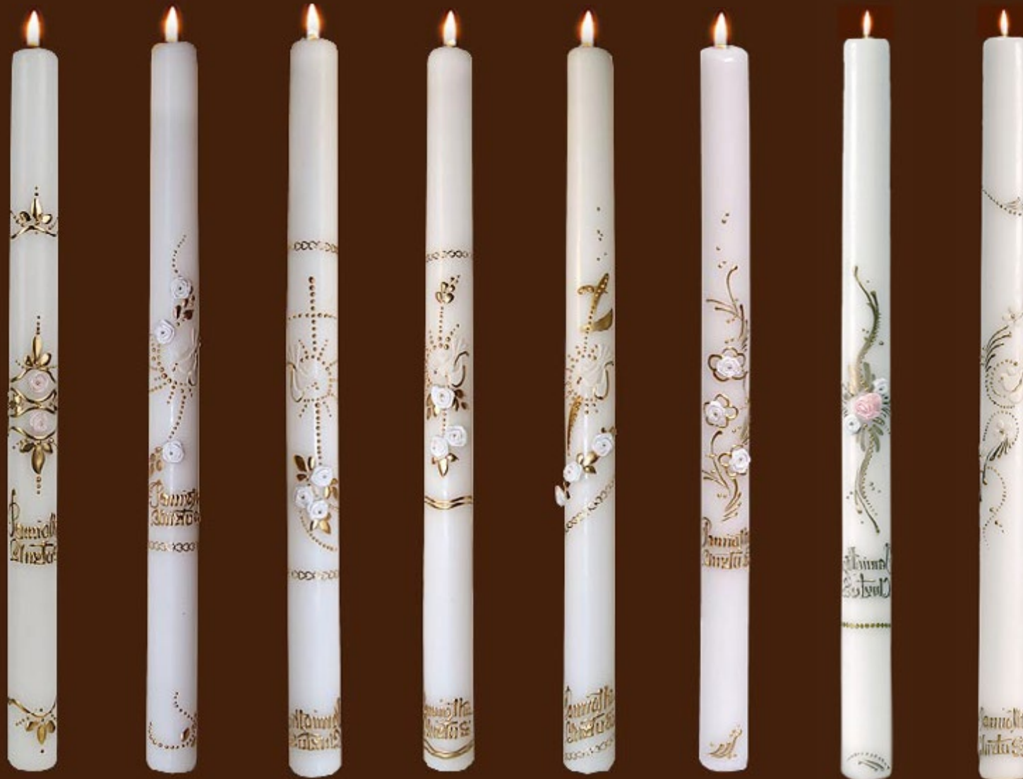
ch 9 DR