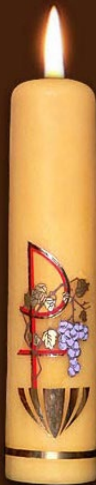
S 5 DS