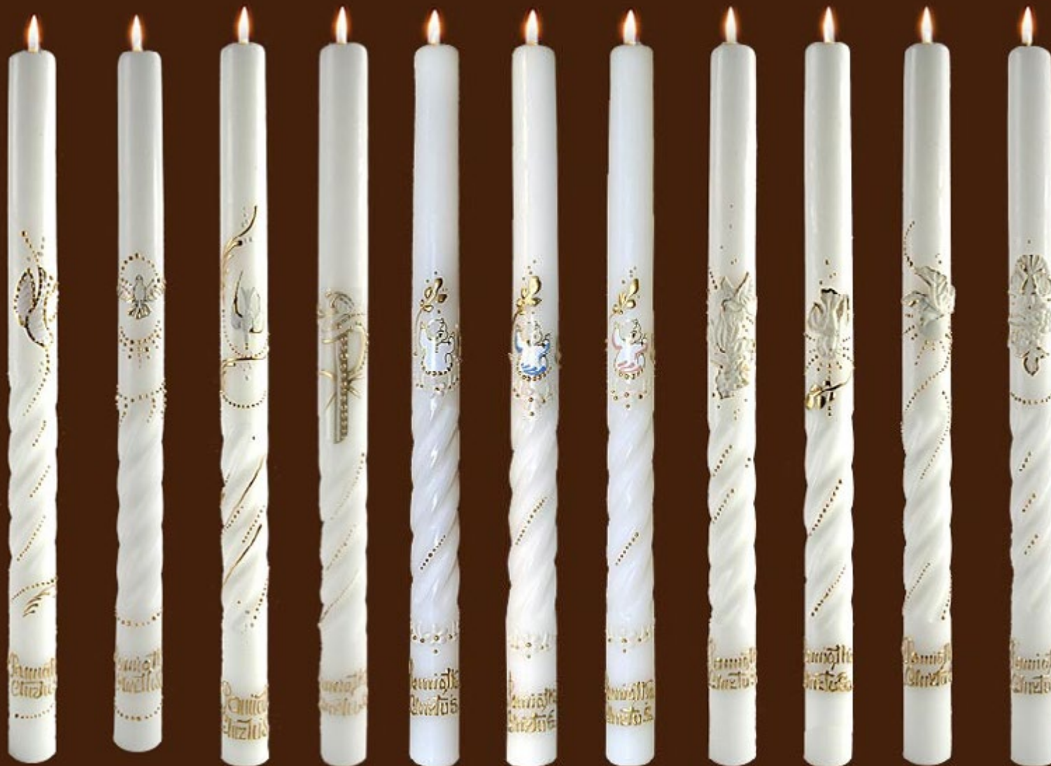
ch 1 R