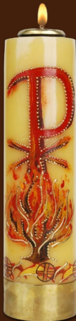
SO 5 DR