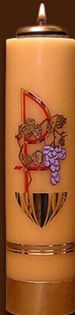
SO 3 DS