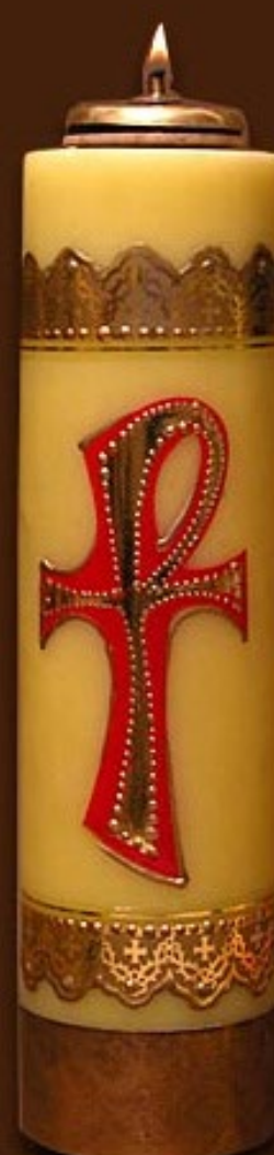
SO 2 DS