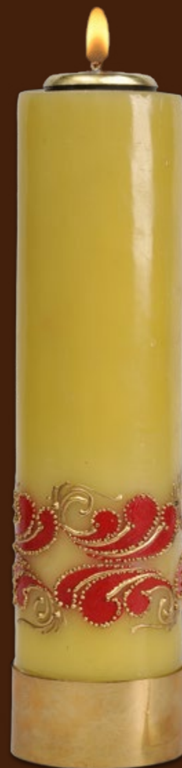
SO 19 DR