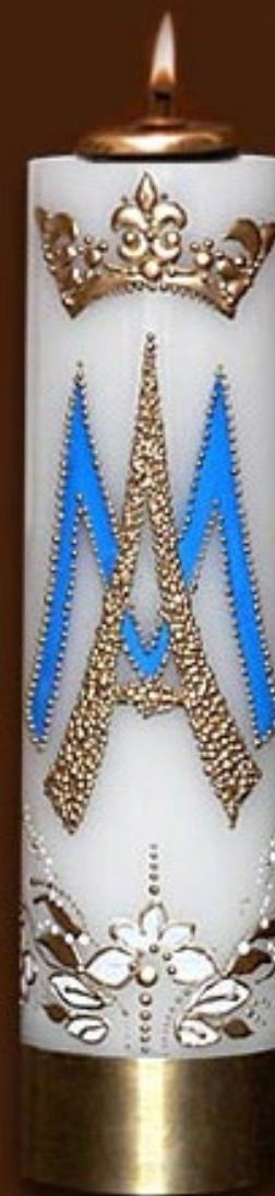
SO 3 DR