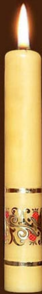
S 6 DS