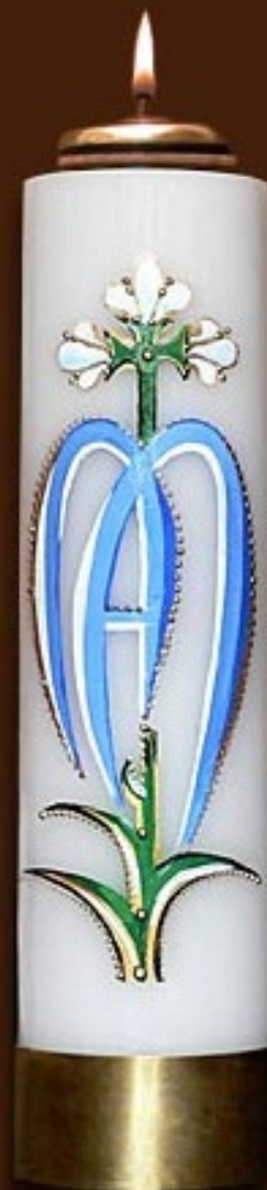
SO 2 DR