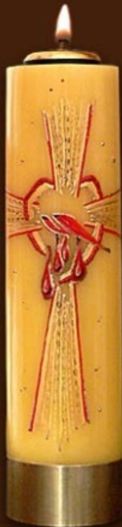
SO 6 DR