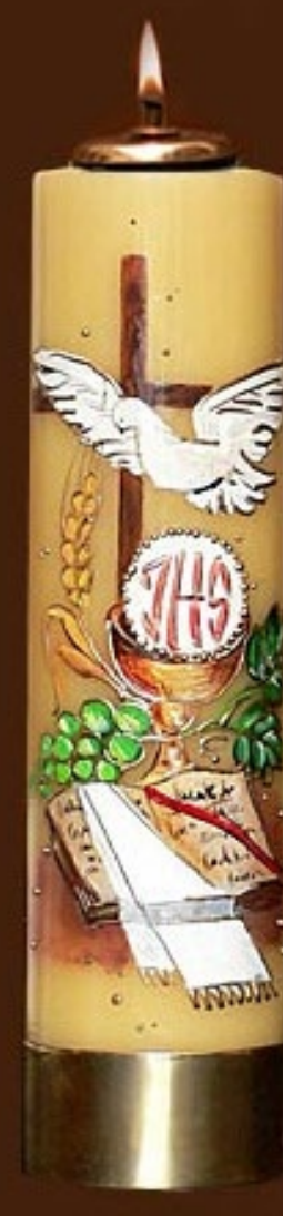
SO 12 DR