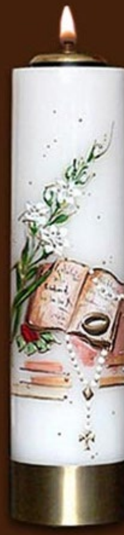
SO 11 DR