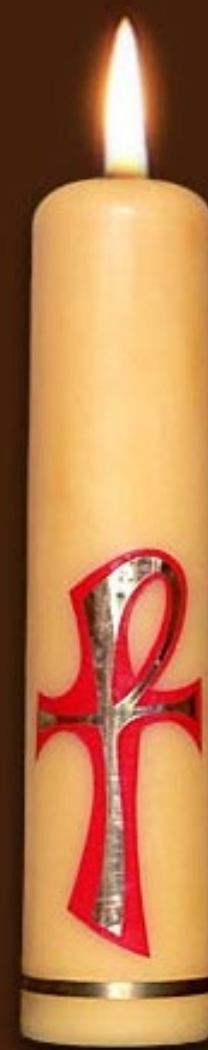
S 4 DS