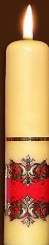
S 7 DS czerwony, fioletowy