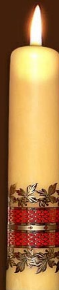
S 9 DS czerwony złoty biały