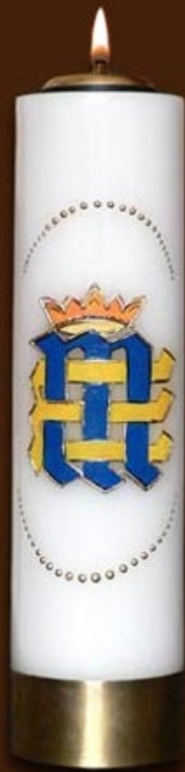
SO 1 DR