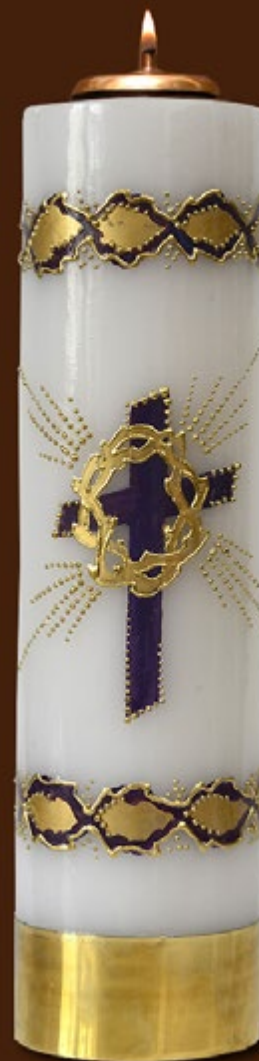
SO 22 DR