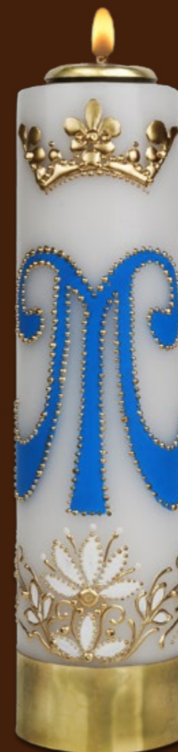
SO 4 DR