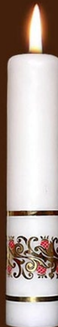
S 3 DS