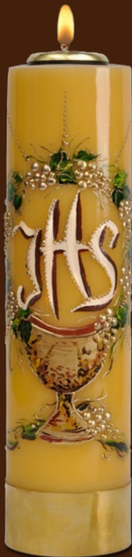
SO 21 DR