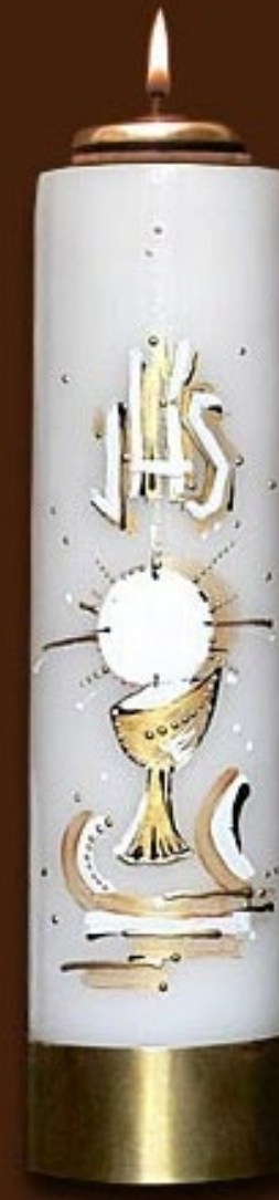
SO 8 DR