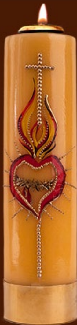
SO 13 DR