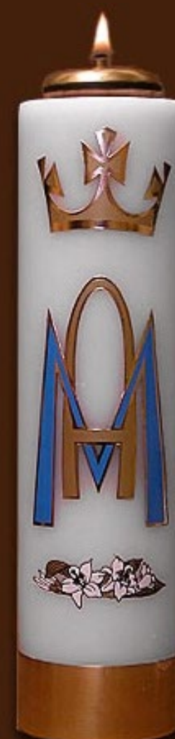
SO 4 DS