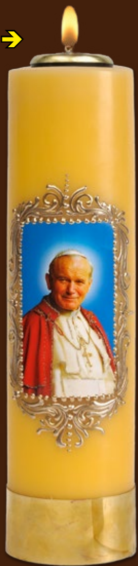
SO 17 DR