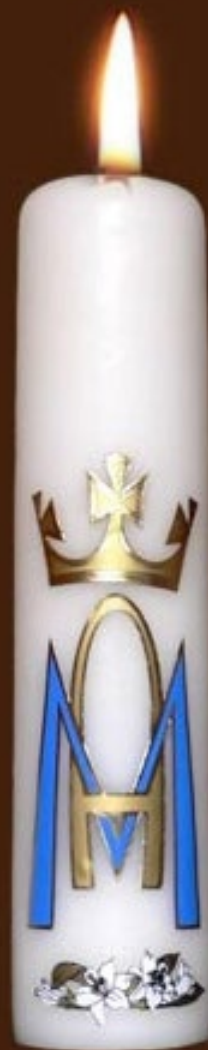
S 2 DS