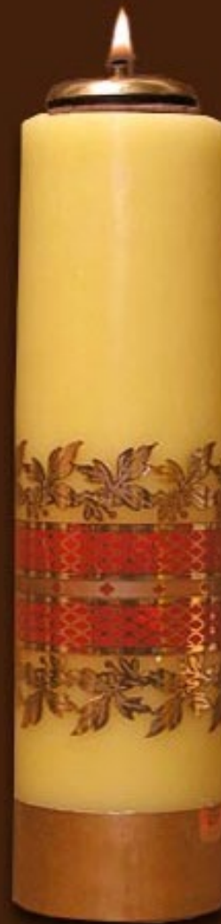
SO 6 DS